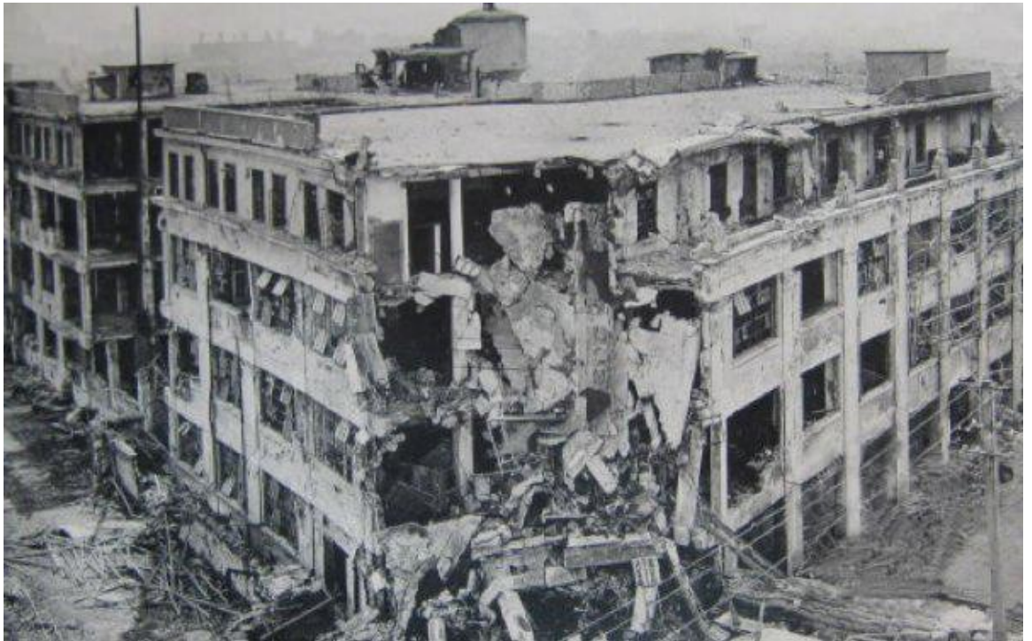
被炸毁的商务印书馆印刷厂